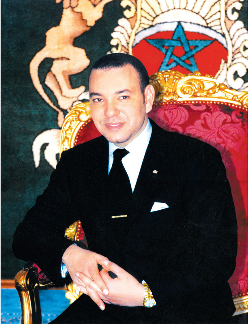
Sa Majesté le Roi Mohammed VI que Dieu L'assiste